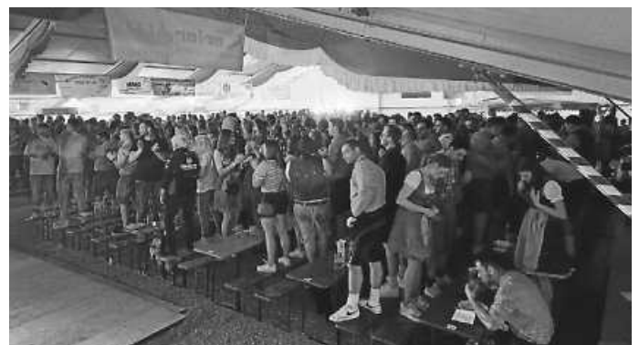
doba bleiba, fertig