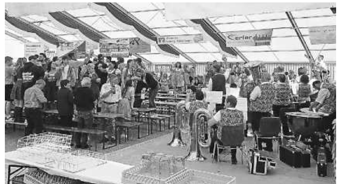
Auf die Bänke,